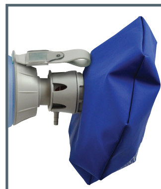
Réservoir O 2 fermé