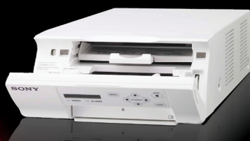
Accès facile par ouverture frontale

Succédant à notre célèbre série UP-20 d'imprimantes médicales, ces imprimantes sont aussi compactes que les modèles précédents pour une grande facilité d'utilisation. Conçues pour fournir une fiabilité à long terme tout en vous offrant des impressions de qualité photo très longue durée et de superbe qualité, ces deux imprimantes permettent de réduire les coûts d'entretien de manière très intéressante. Alors que l'UP-D25MD offre tous les avantages de la technologie numérique, l'UP-25MD est le choix idéal si vous souhaitez remplacer vos anciennes imprimantes analogiques A6 1 .