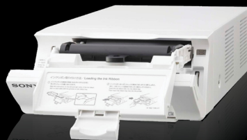
Remplacement simple de la cartouche de toner