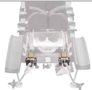
schaerer® Carbon Spine Frame avec adaptateur pour rails latéraux