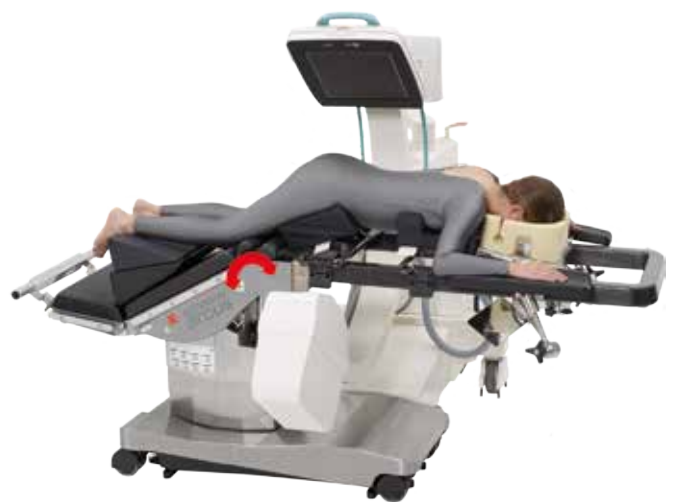
Position de la surface de la table en flex