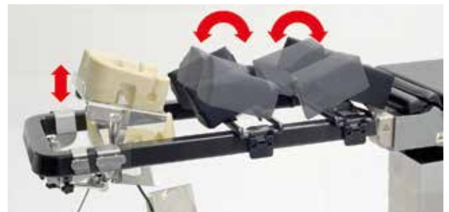
Ajustement des angles et du positionneur à 4 points

solide pendant l'opération et permettent aussi un libre accès à l'abdomen. Avec une capacité maximale de patient de 240 kg (schaerer® arcus) le schaeerer® Carbon Spine Frame supporte aussi les patients obèses.