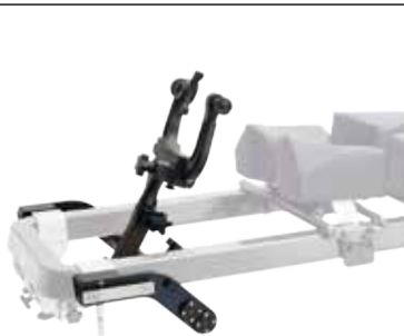
schaerer® Carbon Spine Frame avec unité de base DORO® radiotransparente