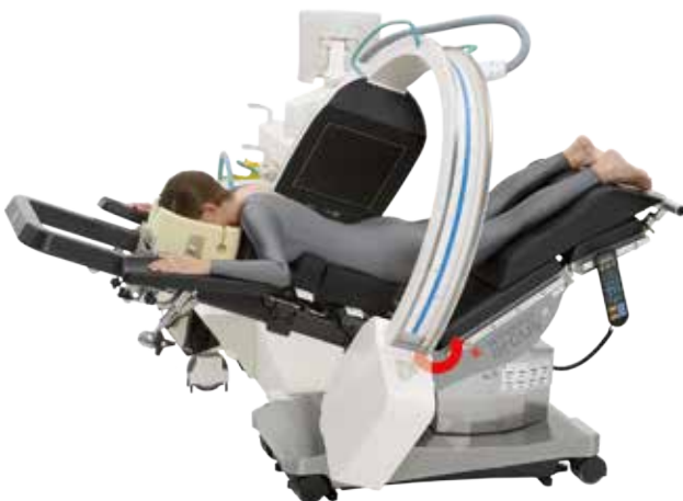
Position de la surface de la table en reflex

de la table à la position flex ou reflex même pendant l'opération. La position basse de la surface de la table permet une position de travail ergonomique au chirurgien et un accès irréprochable au patient.