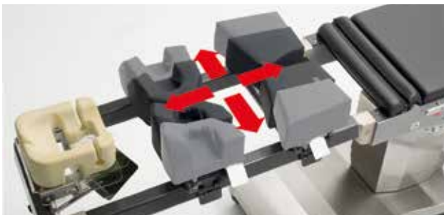
Déplacement en longitude et latéral du positionneur à 4 points

Déplacement latéral individuel et ajustement des angles de coussins à une main. En déplaçant les supports de coussins en longueur, le système s'adapte à des patients de grande taille. Les coussins de forme anatomique et en viscoélastique pour les hommes et les femmes offrent un appui