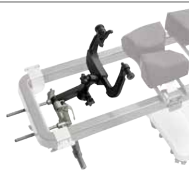
schaerer® Carbon Spine Frame avec unité de base DORO® aluminium