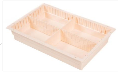
4 pcs 355 x 555 x 100(h) mm