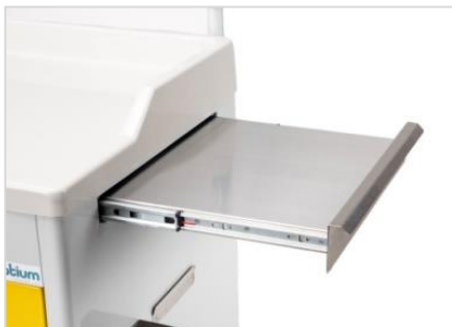
Stainless Steel Retractable Tray