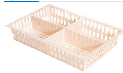
355 x 555 x 100(h) mm