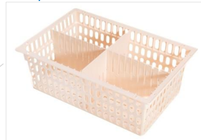
1 pcs 355 x 555 x 200(h) mm