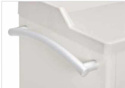
Ergonomic Pushing Handle