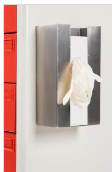
Glove Box Holder