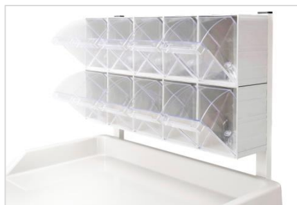
10 boîtes de médicaments inclinables