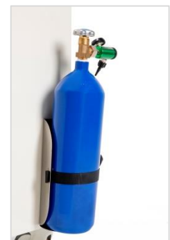
Oxygen Tube Holder