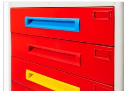
Titulaire de la carte d'identité