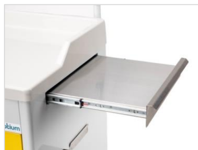
Plateau rétractable en acier inoxydable