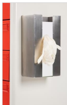
Porte-boîte à gants