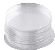
• lamelles, rondes, en boîtes de 100