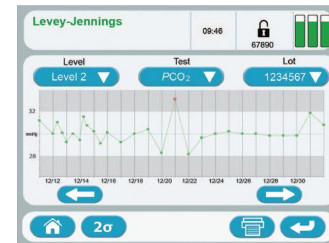
Statistics et rapports CQ sont sauvegardés automatiquement et peuvent être accédés facilement

Le système micro-électronique et la cartouche d'EBG Stat en font l'un des plus petits et des plus légers analyseurs de soins intensifs. La compacité des systèmes EBG Stat signifie qu'il peut être situé n'importe où dans l'hôpital ou peut être utilisé sur un chariot mobile avec une batterie de secours.